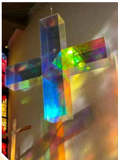
Lichtkreuz von Ludger Hinse, derzeit in der Herz-Jesu-Kirche in Nattheim zu sehen.

Liebe Mitbürgerinnen und Mitbürger, wir wünschen Ihnen ein gesegnetes und von Zuversicht erfülltes frohes Osterfest.