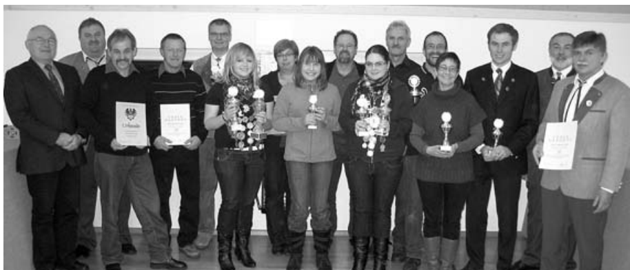
Vereinsmeister, Schützenkönige und geehrte Vereinsmitglieder