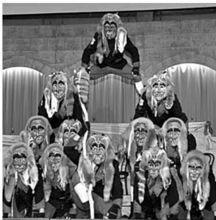
Die Eisbühlgoischdr, seit diesem Jahr alle mit den gleichen Jacken ausgestattet