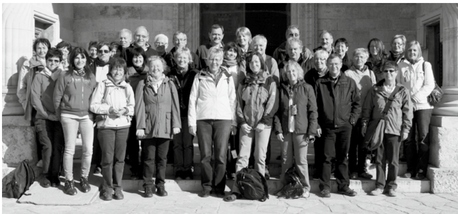
Reisegruppe auf dem Berg Tabor vor der Verklärungskirche

Jordantal und die Wüste Juda nach Jerusalem. Die Gruppe war in einem mittelalterlichen Hotel in der Altstadt untergebracht. Sie ging Jesu Leidensweg vom Ölberg bis zur Grabeskirche nach und erlebte an der Klagemauer und dem Tempelberg die Vielfalt, aber auch die Spannungen der verschiedenen Religionen. Die Schatten der Vergangenheit wurden bei einem eindrücklichen Besuch der Holocaust-Gedenkstätte Yad Vashem deutlich, die politischen Spannungen der Gegenwart auf der Fahrt nach Bethlehem. Entspannender war ein Tag am Toten Meer mit Besuch der Festung Masada und in Qumran. Die vielfältigen Eindrücke werden die Teilnehmer noch lange beschäftigen.