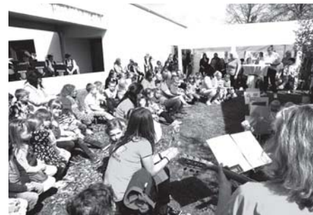
Kinderhaus St. Johannes

Für das leibliche Wohl sorgte die Metzgerei Bihl sowie die zahlreichen Kuchen Spenden unserer Eltern. Der Musikverein Dischingen sorgte für gute Unterhaltung. Ein herzliches Dankeschön an alle, die zum Gelingen des Festes beigetragen haben.