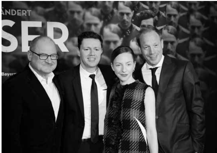
Unser Bild zeigt die Hauptdarsteller, von links Burghart Klaußner, Christian Friedel, Katharina Schüttler und Johann von Bülow.

Der Film, der tags darauf auch in Zürich Premiere feierte, wurde weltweit verkauft und wird in nahezu allen Ländern gezeigt.